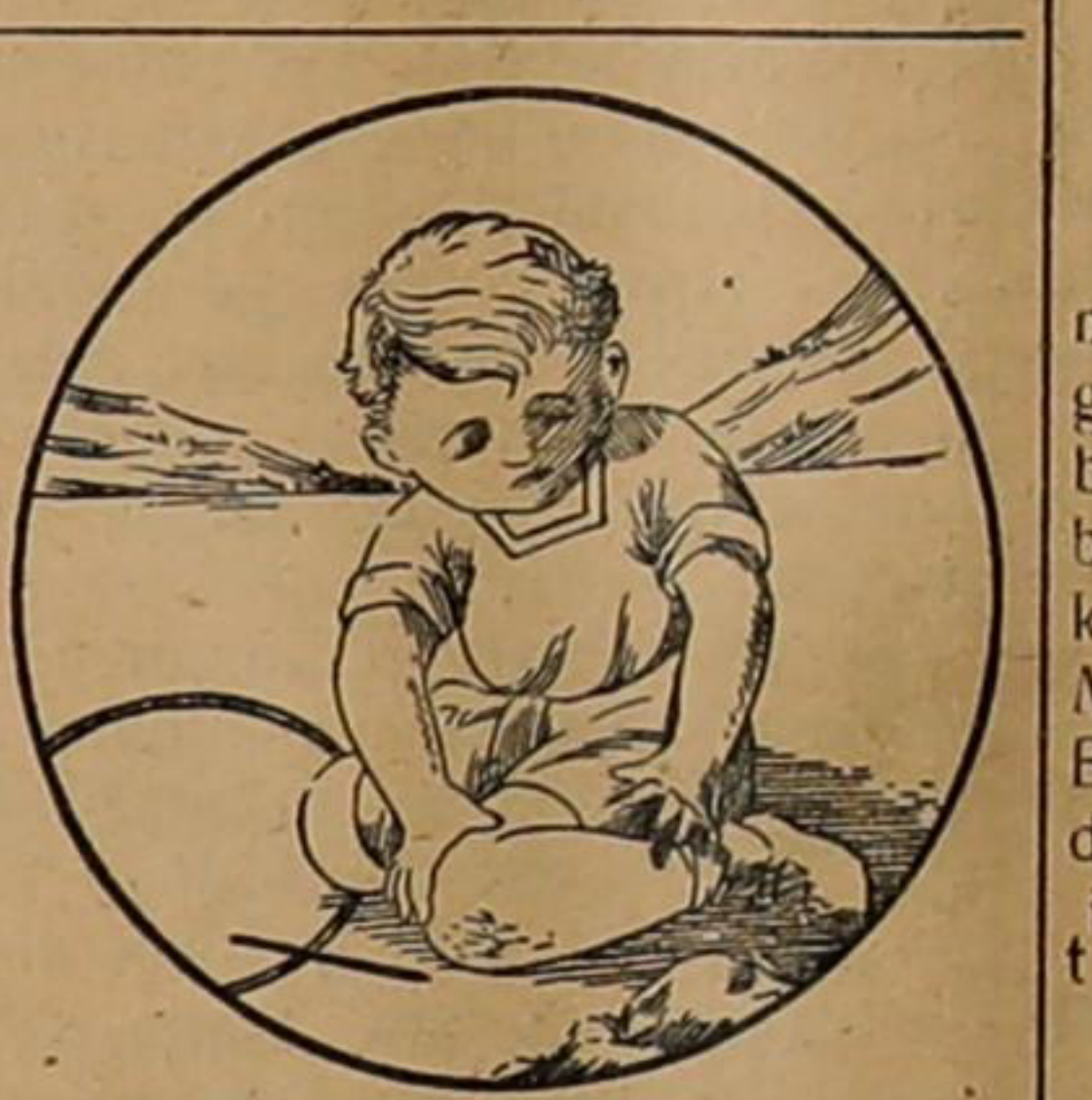
„Nah Dia Djatoeh lagi”

Menoeroet keterangan officiel satoe onder - officier bangs Tjs ch soeda riboet moeloet dengan 35 Sudeten Duitschers. Ini officier kamoedian tjaboet ia